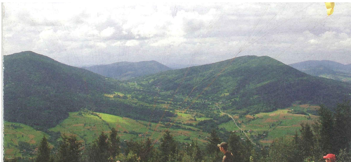
Beskid wyspowy z widokiem białej, jak kawałek nitki, drogi do góry, do wsi Bedlno